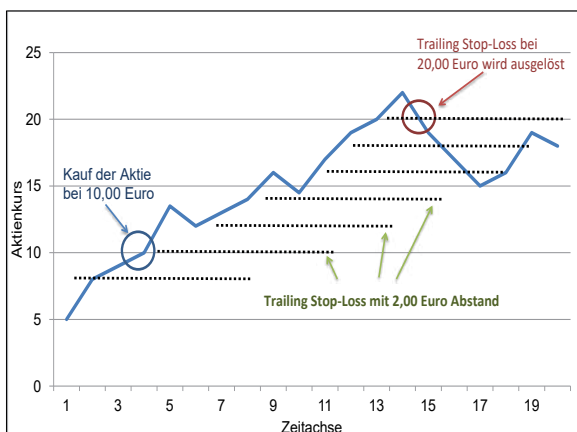
Im Beispiel wurde eine Aktie bei 10,00 Euro gekauft. Zum Schutz vor Verlusten haben Sie einen Trailing-Stop mit 2,00 Euro Abstand gesetzt. Der anfängliche Stop-Loss liegt also bei 8,00 Euro. Mit dem steigenden Kurs wird dieser automatisch nachgezogen und bei der ersten stärkeren Korrektur wird das Stop-Limit ausgelöst.

einmal erreichten Niveau. Hat der Kurs das vorgegebene Stop-Niveau erreicht, wandelt sich die Trailing-Stop-Order in eine Market Order um und der Verkauf findet ohne Limit, also „bestens“ statt. Der Trailing-Stop ist aber zur Absicherung in der langfristigen Aktienanlage nicht geeignet, denn es besteht die Gefahr zu schnell ausgestoppt zu werden.